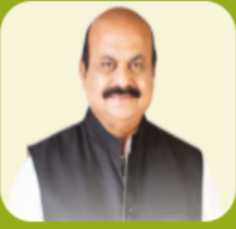
ಶ್ರೀ ಬಸವರಾಜ ಎಸ್. ಬೊಮ್ಮಾಯಿ ಮಾನ್ಯ ಮುಖ್ಯಮಂತ್ರಿಗಳು