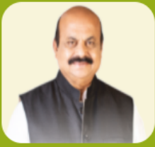
ಶ್ರೀ ಬಸವರಾಜ ಎಸ್. ಬೊಮ್ಮಾಯಿ ಮಾನ್ಯ ಮುಖ್ಯಮಂತ್ರಿಗಳು