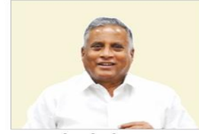
ಶ್ರೀ ವಿ ಸೋಮಣ್ಣ ಮಾನ್ಯ ವಸತಿ ಹಾಗೂ ಮೂಲ ಸೌಲಭ್ಯ ಅಭಿವೃದ್ಧಿ ಸಚಿವರು ಕರ್ನಾಟಕ ಸರ್ಕಾರ

ವಸತಿ ಇಲಾಖೆ ರಾಜೀವ್ ಗಾಂಧಿ ವಸತಿ ನಿಗಮ ನಿಯಮಿತ (ಕರ್ನಾಟಕ ಸರ್ಕಾರದ ಒಂದು ಉದ್ಯಮ)