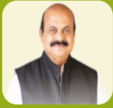
ಶ್ರೀ ಬಸವರಾಜ ಎಸ್. ಬೊಮ್ಮಾಯಿ ಮಾನ್ಯ ಮುಖ್ಯಮಂತ್ರಿಗಳು