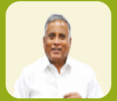
ಶ್ರೀ ವಿ.ಸೋಮಣ್ಣ ಮಾನ್ಯ ವಸತಿ ಹಾಗೂ ಮೂಲ ಸೌಲಭ್ಯ ಅಭಿವೃದ್ಧಿ ಸಚಿವರು

ನಿಮ್ಮ ಅರ್ಜಿ ಸಂಖ್ಯೆ ಅನ್ನು ನಮೂದಿಸಿ(Enter your Application Number) 20216001021