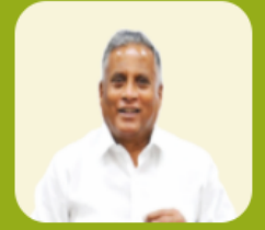
ಶ್ರೀ ವಿ.ಸೋಮಣ್ಣ ಮಾನ್ಯ ವಸತಿ ಹಾಗೂ ಮೂಲ ಸೌಲಭ್ಯ ಅಭಿವೃದ್ಧಿ ಸಚಿವರು