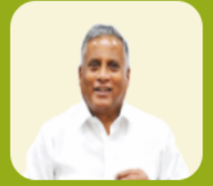
ಶ್ರೀ ವಿ.ಸೋಮಣ್ಣ ಮಾನ್ಯ ವಸತಿ ಹಾಗೂ ಮೂಲ ಸೌಲಭ್ಯ ಅಭಿವೃದ್ಧಿ ಸಚಿವರು

ರಾಜೀವ್ ಗಾಂಧಿ ವಸತಿ ನಿಗಮ ನಿಯಮಿತ ಮುಖ್ಯಮಂತ್ರಿಗಳ ಬಹುಮಹಡಿ ಬೆಂಗಳೂರು ವಸತಿ ಯೋಜನೆ