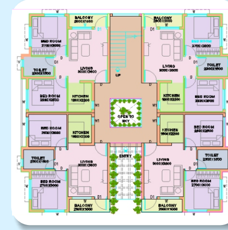
ಮನೆಯ ವಿಸ್ತೀರ್ಣ ಒಟ್ಟು 576 ಚದರ ಅಡಿ (Double Bed Room)